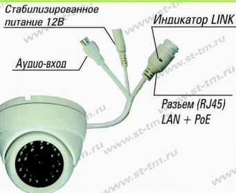
Рис. 1 Схема подключения