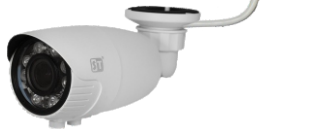
Рис. 1 Схема подключения видеокмеры