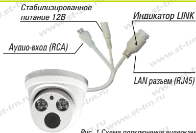
Рис. 1 Схема подключения видеокамеры